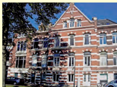
Schotersingel 117a, Haarlem € 1.375.000,00 k.k.