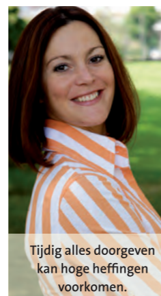
Tijdig alles doorgeven kan hoge heffingen voorkomen.

Belangrijk is dat de verzekeraar tijdig beschikt over een kopie identiteitsbewijs en aanvullende informatie waar