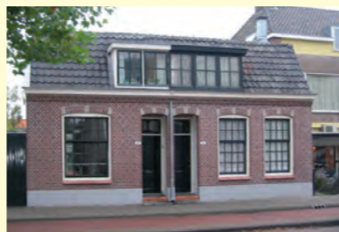
Rijksstraatweg 366, Haarlem € 224.000,00 k.k.

De Heer Makelaardij is specialist in aan- en verkoop van onroerend goed. Hoogbouw, laagbouw, vrijstaand of in een rijtje, noemt u maar op. Een voorbeeld van twee uitersten ziet u hieronder. ♦